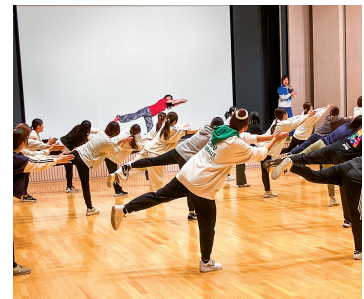
腕や足を大きく伸ばす 運動あそびにチャレンジ!!

この研修は、戸惑いや迷いを感じ始めることが多い就業3～8年の保育士等を対象に、現場で活かせる知識や技術を取得し“気力”と“スキル”を高める一助とすることを目的に開催しています。今年度は、令和7年11月4日に開催し、保育の様々なシーンに役立つ運動あそび、中堅保育士の役割や目指す保育士像の振り返り、地域のつながりを活かした保育力の向上に係る話し合いの3本立てで行いました。参加者からは、「体を動かすことの大切さを知ることができた」「自分の地域の良さに改めて気づけて良かった」などの声が聞かれました。経験年数の近い方との情報交換の場にもなっていますので、次年度開催の際には、たくさんのご参加をお待ちしています。