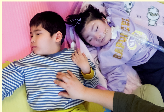
身体に触れる、声をかけるなど子どもたちとのスキンシップを大切にしています

経鼻経管栄養で鼻から食事を摂っていたため、口から食べることへの意欲が乏しかった子が、次第に口から食事できるようになったことがありました。保育園に通うことで、ほかの子どもたちの食事の様子を見たり、保育士や看護師の声掛けがあったことも、自分で口から食べたいと思うきっかけの一つになったのかなと話し、保護者と一緒に成長を喜んだことが印象に残っています。