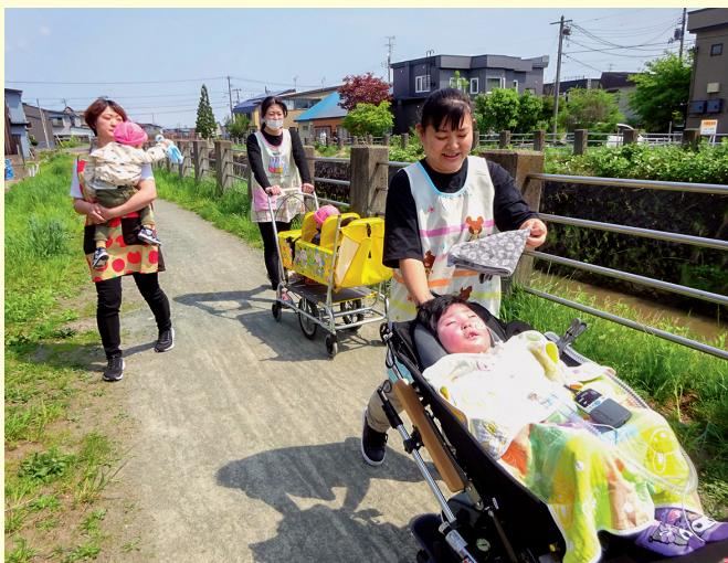
お散歩を楽しむ子どもたちの姿に、保育士も笑顔になります

発作や痙攣がある子は体調変化の見極めが重要で、「保育活動に参加する上で気を付けること」「体調が悪くなった時の対応」などを保育士と看護師が互いに意見を出し合い、相談しながら日々の保育をしています。