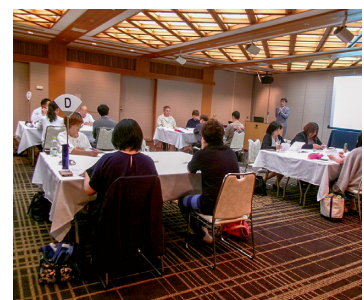
自法人や地域をさらに良くする 施策や活動を話し合う参加者

令和7年9月19日に、保育施設管理者等を対象としたマネジメント研修を開催しました。今回は『組織の目標を立て、課題解決に取り組む』ために、基本理念と自らマネジメントしなければならない資源（職員の持ち味、職員の育成や育成方針、法人や施設の強みや弱み、地域の特性等）を確認し、改めて自組織を再構築していく考え方や地域になくてはならない施設づくりを、演習を交えながら学習しました。参加者から「知らなかった情報や知識、概念などが多く勉強になった」「自分の役割を再確認することができた」といった感想がありました。職員の育成を効果的に行って就労継続につなげ、地域に必要な施設を目指して行くために、本研修をご活用ください。