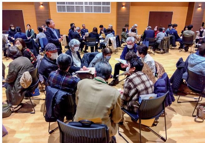
ご近所挨拶や地域行事、趣味活動など、身近に様々なつながりがあることを話す田舎館村の座談会の様子

座談会では、日常の何気ないつながりや行っている活動について話し合い、その意味や効果を住民同士で共有したほか、住民と専門職の役割や地域づくりについて考える機会となりました。