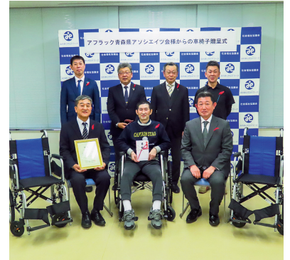
車椅子贈呈式の様子

今回寄贈いただきました車椅子は社会福祉法人喜伴会 障害者支援施設 津麦園様にお渡しし御活用いただいております。温かい「善意」まことにありがとうございます。